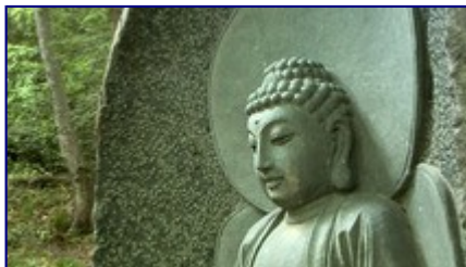
道の端から参拝者を見守る美しい仏像