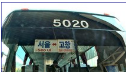
ゴーチャン行き的高速バス