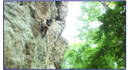
96女子予選 5.12a の核心のムーブを組み立てる FS さん