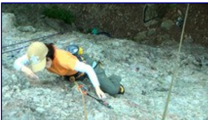
難しい 5.10a を登る A さん

で、「今日の料理は？」と言うと、石焼ビビンバにパチョン。パチョンと言えば、ドンドンシュ(どぶろく)だ。ドンドンシュのビンの底に粕が溜まっているので、振ろうとすると「そうでない」という。おばさんにしか出来ないドンドンシュ・ダンスでビンをシェイクした。ひとつひとつの儀式が大変。ハハーッ、とんでもないことでございます。