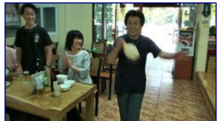
ドンドンシュ・ダンスを披露するおばさん