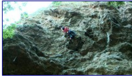
JJC 5.11a の核心を突破する FT さん