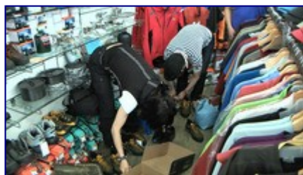
ガンダルフを試着