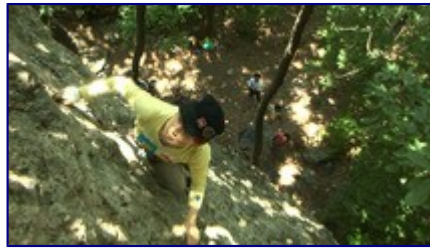
ムン岩をリードする Y さん