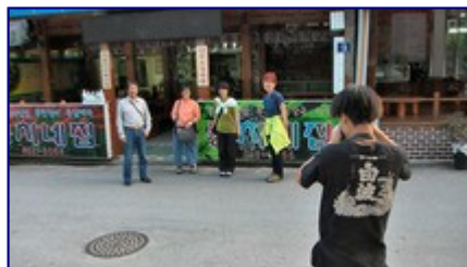
クライマーご用達の食堂の前