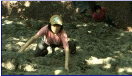
ムン岩をリードする A さん